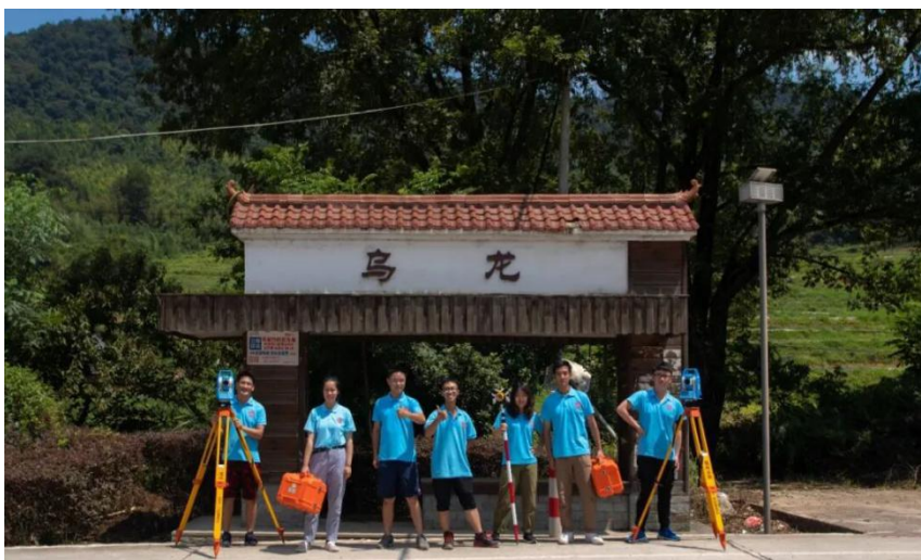
福州大学“福小测”志愿服务项目获市委文明办立项扶持

福州大学测量协会“福小测”构建美丽中国新农村项目入选。福州大学测量协会是一个学术性的学生组织，创办于 2011 年，核心人数 40 余人，注册志愿者 1500 余人，于 2019 年被评为福州大学星级社团。该协会立足于土建专业优势，从 2012 年开始，连续 8 年组建并派出测绘志愿服务队，深入贫困山村支持美丽乡村建设，先后为福州市永泰县在内的 23 个行政村落完成 1: 500 精度地形图的测绘规划服务。截至目前，该项目累计创造测绘规划价值 500 万元，协助各地贫困村落申请扶贫基金 2150 余万元，协助当地开发特色产业。（校文明办供稿）