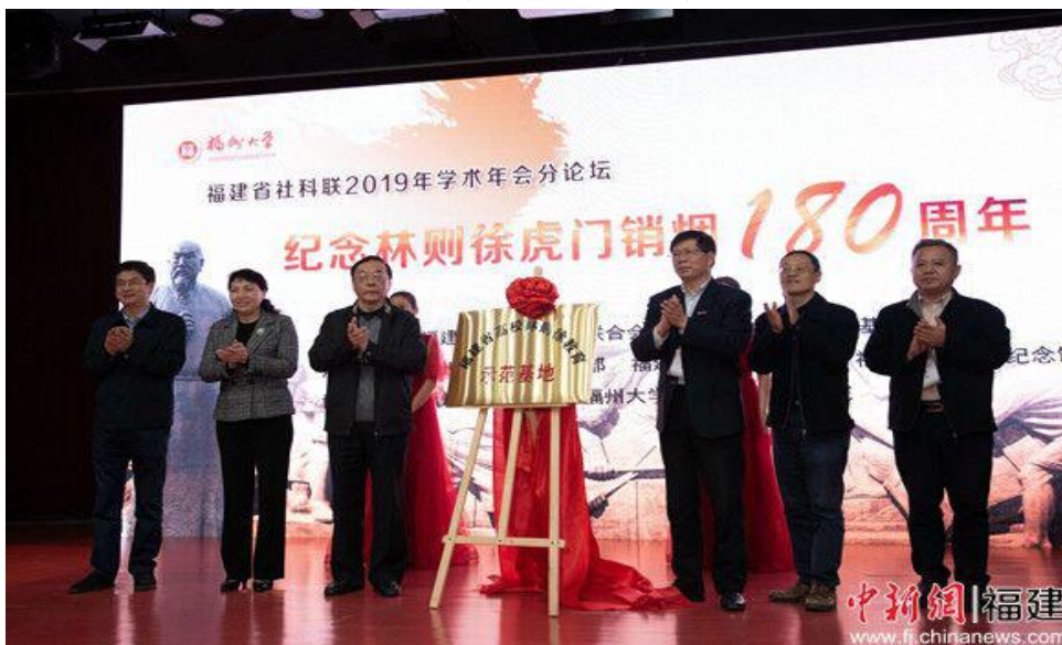
2019-11-29 福州大学举行福建省社科联 2019 年学术年会分论坛“纪念林则徐虎门销烟 180 周年”