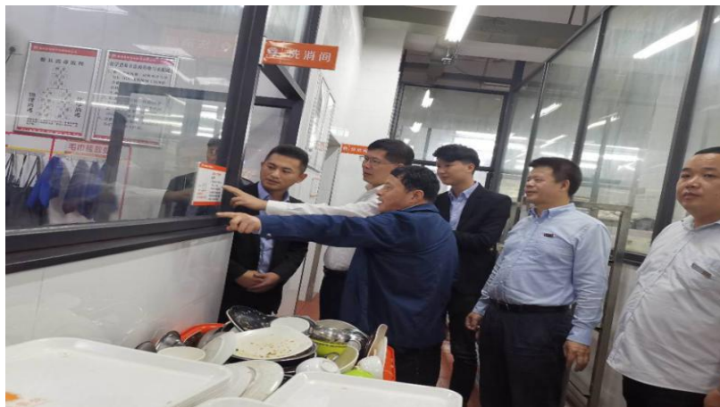
2019-11 福州大学党委书记张天明调研指导后勤餐饮服务

据悉，学校为贯彻落实上级进一步做好学生食堂工作的要求，针对近期物价居高不下的情况，及时启动了福州大学学生食堂价格平抑基金，确保食堂饭菜价格稳定。同时将各种食品原材料价格及时定期进行公示，让学生了解市场物价，理解学校后勤工作。学校各部门也积极联动配合，深入细致地做好学生思想政治教育工作，保证学生稳定。（党办校办供稿）