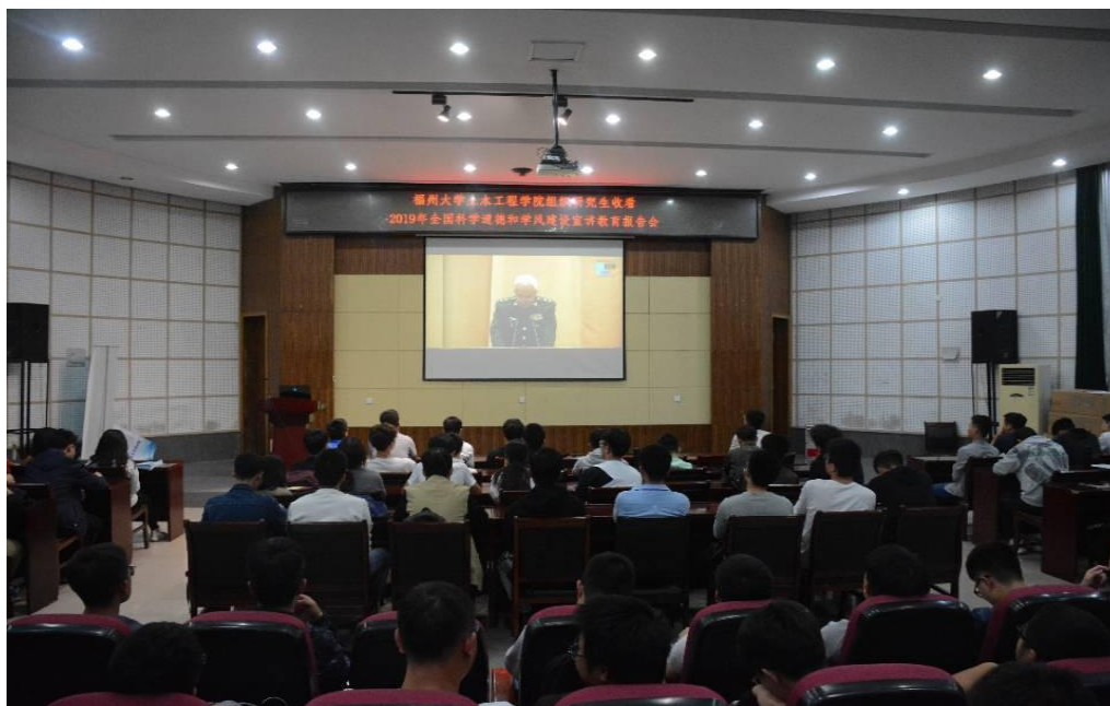
2019-11-13 福大组织收看 2019 年全国科学道德和学风建设宣讲教育报告会

本次报告会的主题为“以习近平新时代中国特色社会主义思想为引领，大力弘扬科学家精神，加强科学道德和学风建设”。自2011年起，全国科学道德和学风建设宣讲教育报告会已连续举办9年，福州大学学生工作部（处）、研究生工作部（处）积极响应落实，每年认真组织师生参与。此次报告会的学习，使福大师生对科学道德的认识更加统一，遵守学术规范、坚守学术诚信、完善学术人格、维护学术尊严的意识更加坚定。（学生工作部（处）、研究生工作部（处）供稿）